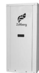
Чиллеры с водяным охлаждением конденсатора до 200 кВт