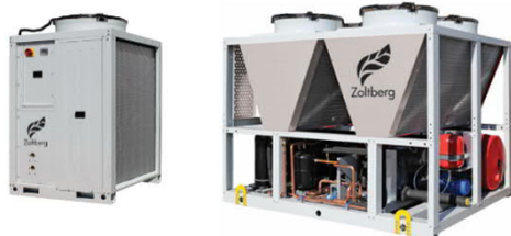
Чиллеры с воздушным охлаждением конденсатора до 200 кВт