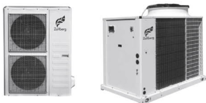
Компрессорно-конденсаторные блоки от 5 до 600 кВт